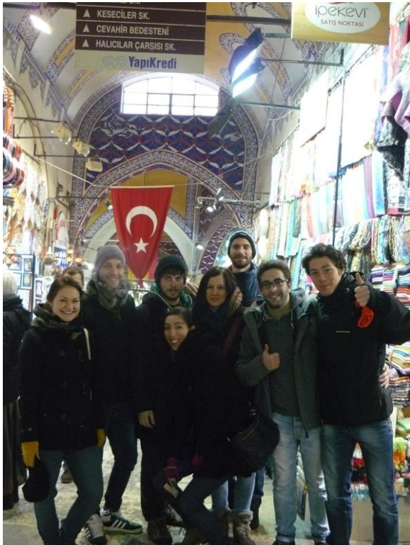
Istanbul – Gran Baazar

Slike sa putovanja po Rumunjskoj koje je organizirala ESN udruga za 50-ak studenata iz cijele Bugarske.