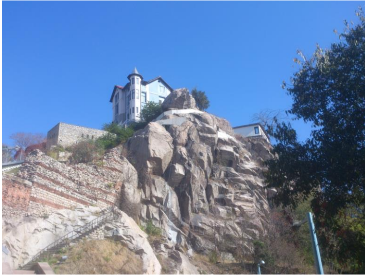
Plovdiv – stari grad na jednom od sedam brda u gradu