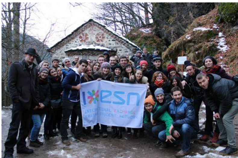
ERASMUS putovanje – ispred Spilje sv. Ivan Rilski

ERASMUS studenti iz cijele Bugarske svakih mjesec dana idu na putovanje po Bugarskoj ili drugim graničnim zemljama.