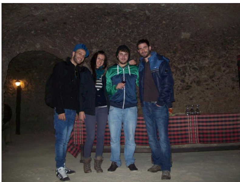
Melnik – vinski podrum star više od 300 godina

ERASMUS studenti iz cijele Bugarske svakih mjesec dana idu na putovanje po Bugarskoj ili drugim graničnim zemljama.