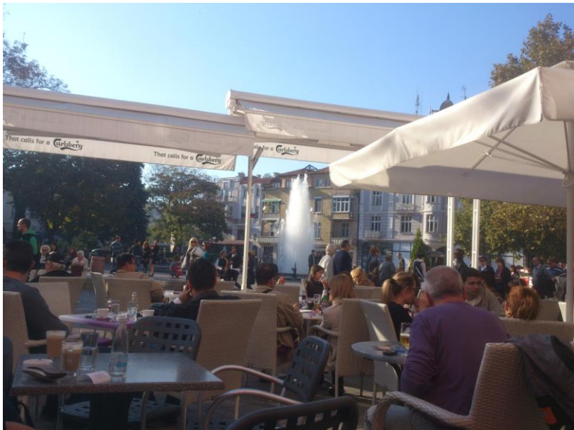
Plovdiv - centar