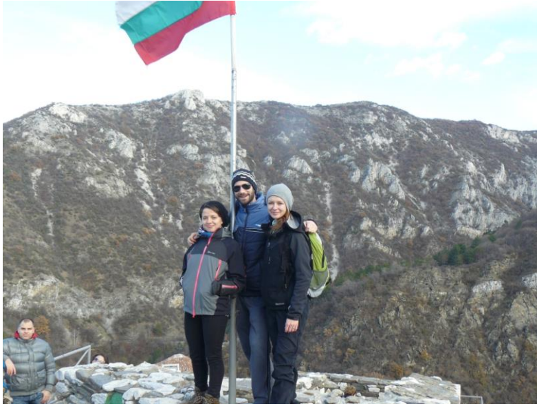
Asenovgrad – tvrđava

Nekoliko slika iz Turske (putovanje koji smo nas 10-ak studenata sami organizirali). Istanbul je jako blizu Plovdiva, pa smo za sitne novce vidili naluđi grad u Europi.