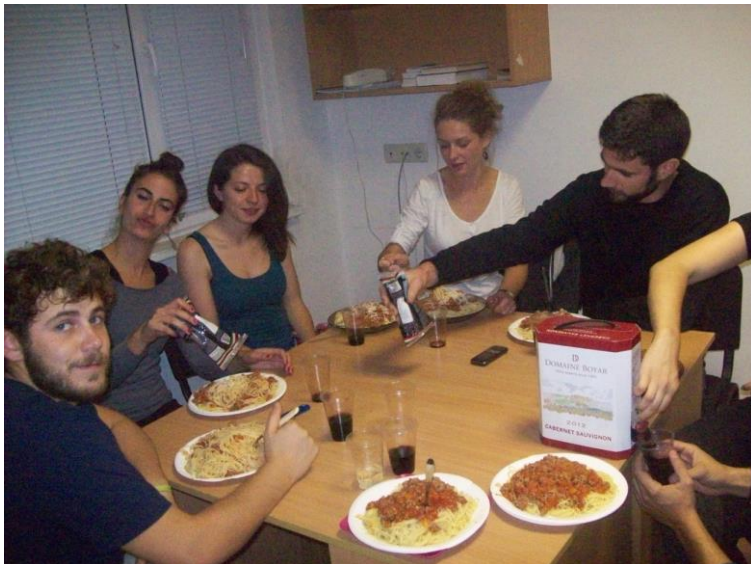
Soba u studentskom domu – internacionalna večera

Kad bi se zasitili od pustih kebaba organizirali bi večere u studentskom domu koji ima na svakom katu zajedničku kuhinju.