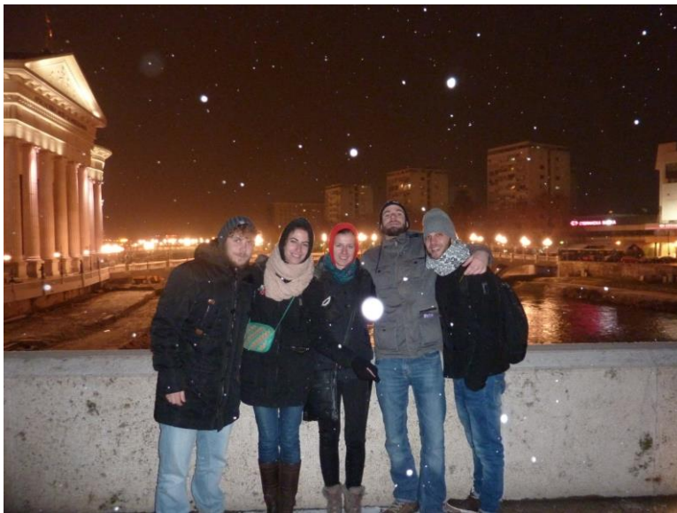
Skopje - centar

Ovo iskustvo je bilo iskustvo mog života. Usavršio sam engleski jezik, našio pokoju riječ Bugarskog. Upoznao drugačiju kulturu, ljude, hranu, vino. Družio sam se sa ljudima iz cijelog svijeta, iz barem 20 država. Sklopio neka doživotna prijateljstva. Proputovao pola Bugarske, i još par drugih graničnih zemalja.