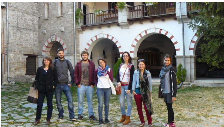
Bačkovo – manastir