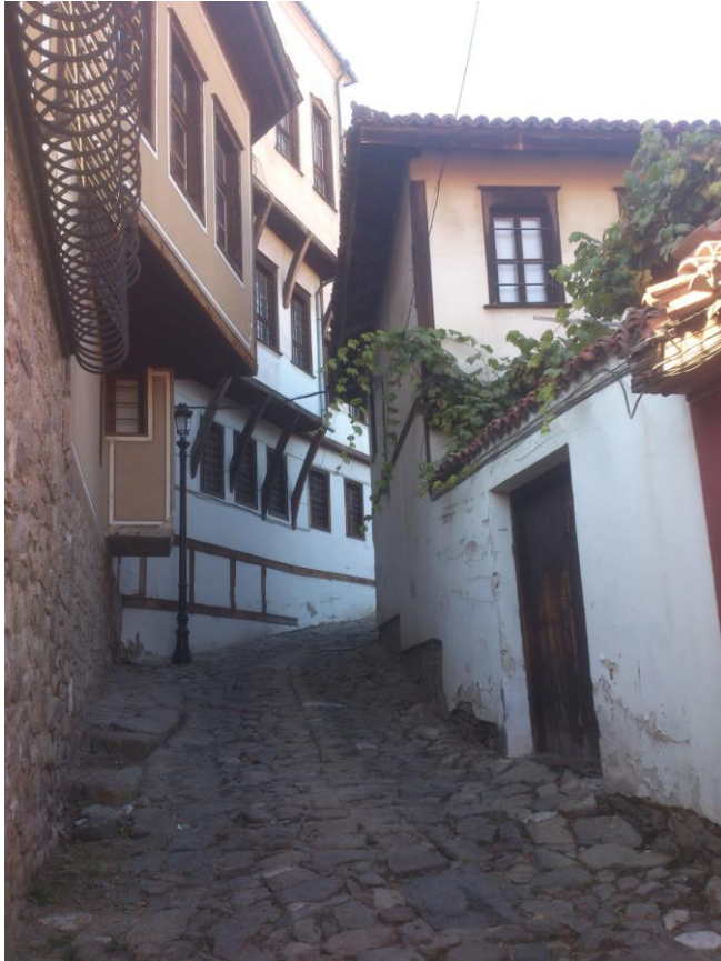
Plovdiv – uličice starog grada