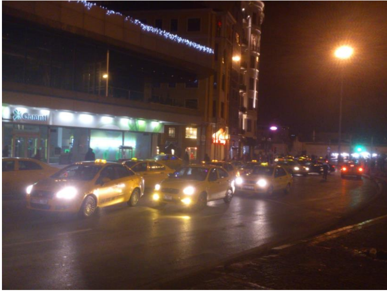
Trg Taksim – noćni život