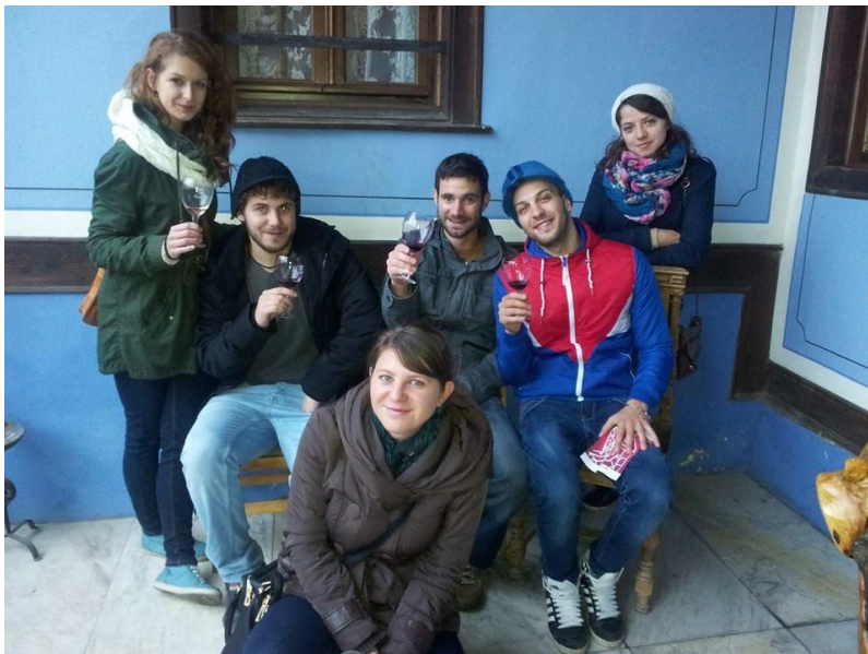
Plovdiv, stari grad – degustacija vina

Plovdiv obiluje rimskim građevinama koje su savršeno očuvane jer su se nalazile ispod grada u vrijeme vladavine Turaka.