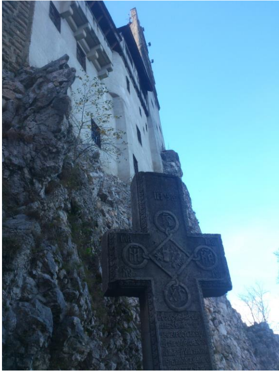
Dvorac grofa Drakule