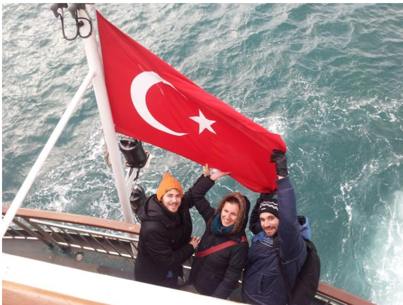
Istanbul - Bospor

Nekoliko slika iz Turske (putovanje koji smo nas 10-ak studenata sami organizirali). Istanbul je jako blizu Plovdiva, pa smo za sitne novce vidili naluđi grad u Europi.