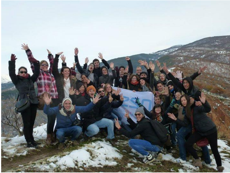
Planina Rila – ERASMUS studenti iz cijele Bugarske